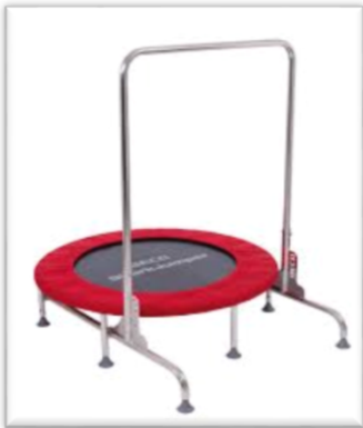
◎ Shark Jumper (水中トランポリン)